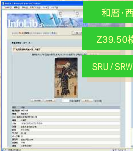
画像と目録情報の表示