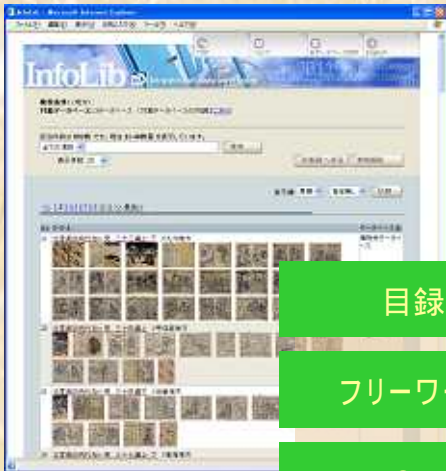
サムネールの表示